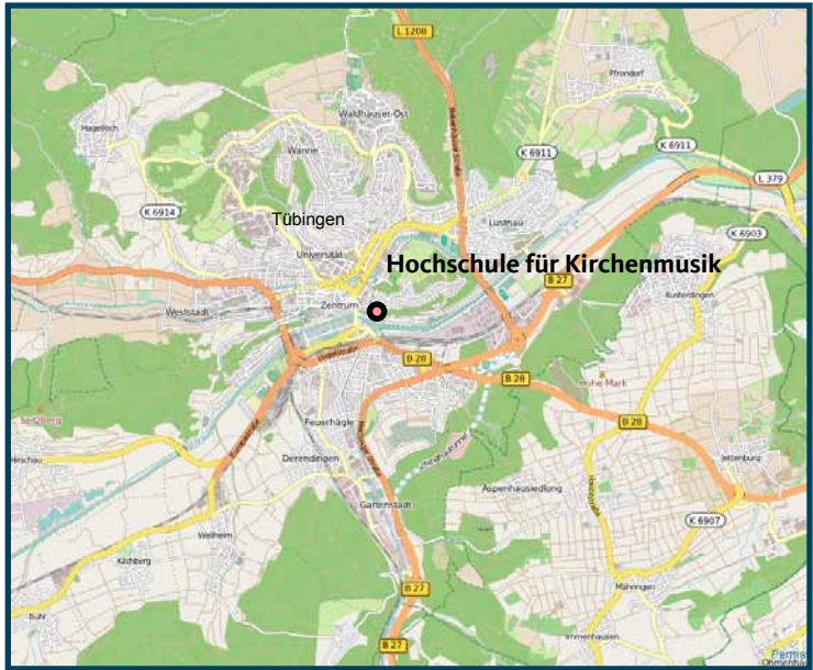
Lageplan der Tübinger Hochschule