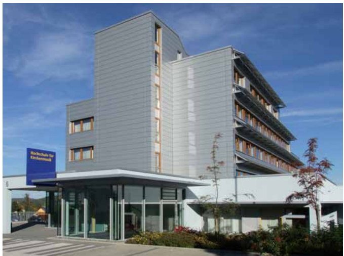
Die Hochschule für Kirchenmusik Rottenburg