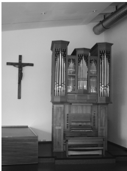
Orgel im Saal der Hochschule für Kir- chenmusik Rotten- burg