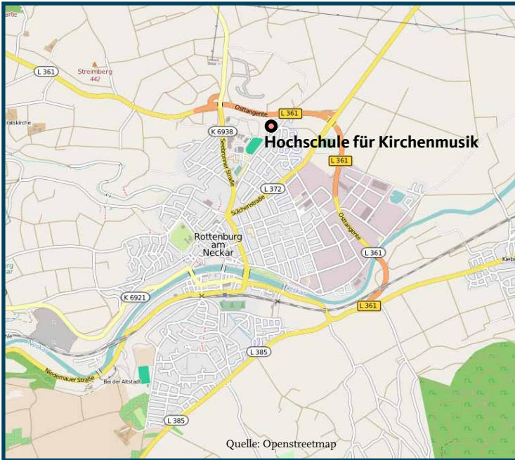
Lageplan der Rottenburger Hochschule