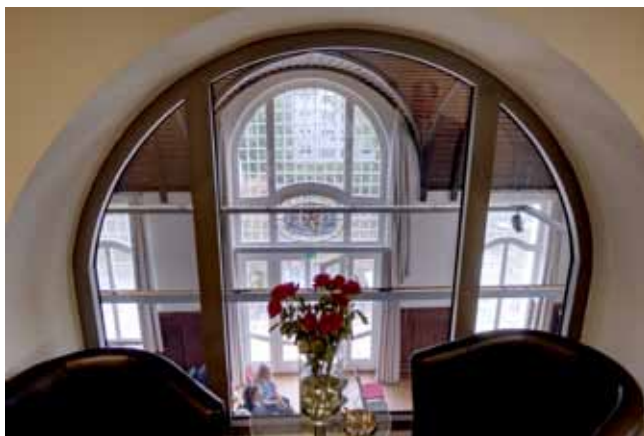
Blick von oben in den Saal der HKM Tübingen