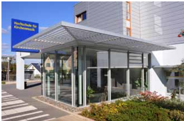
Der Eingangsbereich der HfK Rottenburg