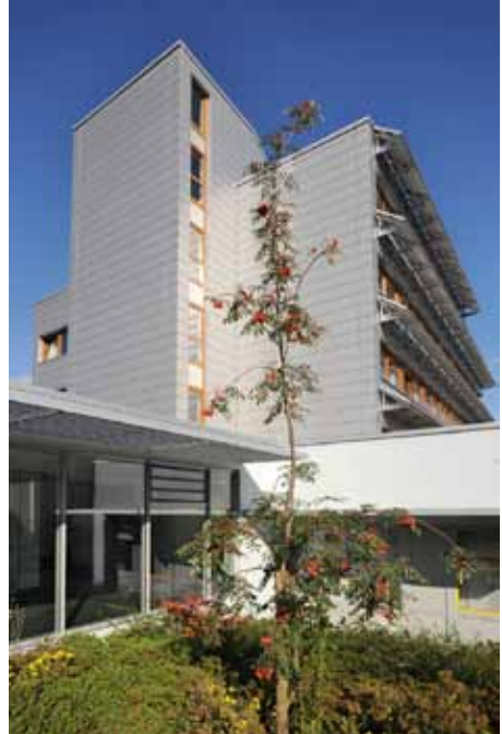
Die Hochschule für Kirchenmusik der Diözese Rottenburg- Stuttgart