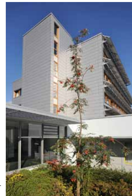
Die Hochschule für Kirchenmusik der Diözese Rottenburg- Stuttgart