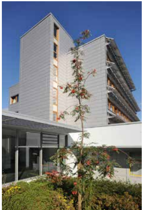
Die Hochschule für Kirchenmusik der Diözese Rottenburg- Stuttgart